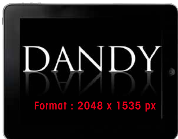
IPAD ET WEB

VIA MAIL : technique@dandy-magazine.com et vbricout@dandy-mag.com